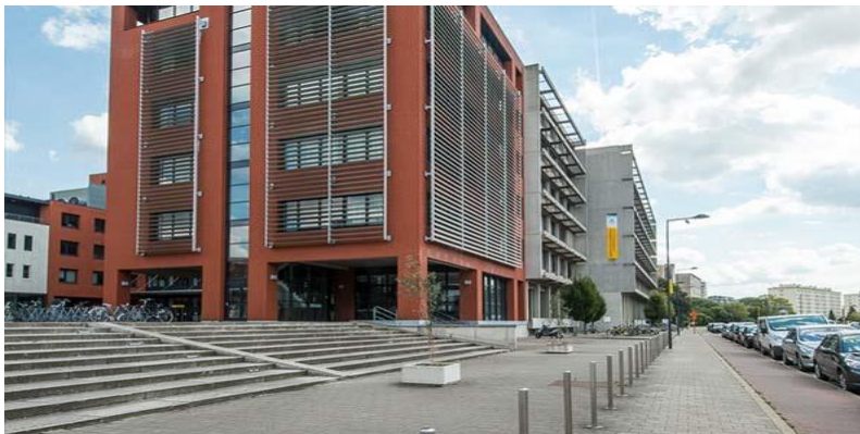
Henri Dunantlaan 2

De lessen zullen vaak doorgaan in één van volgende gebouwen: